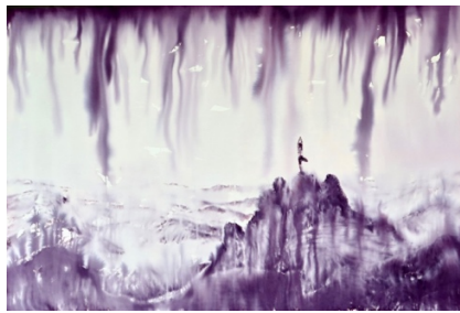
TREE © Dieter Mammel