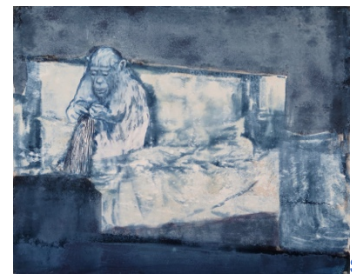
LOST © Dieter Mammel

Dieter Mammels Bilder vermitteln eine melancholische Ernsthaftigkeit, die mit dem Surrealen, dem Unbewussten spielt. Oder man erkennt aktuelle, globale Themen wie Migration, Umweltbelastung, Klimakrise und Artenbedrohung.